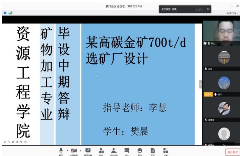
矿物加工工程专业毕业设计（论文）中期答辩