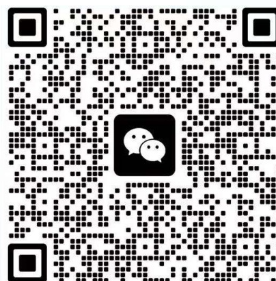
会议交流群二维码